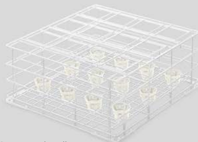
Cesta para botellas